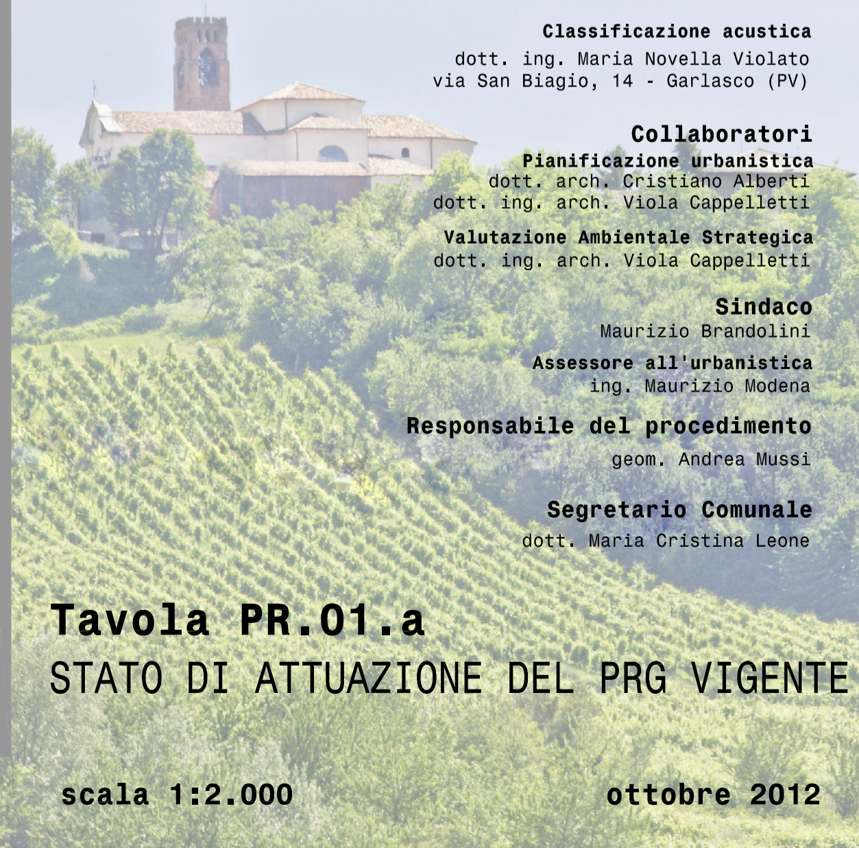
Tavola PR.01.a STATO DI ATTUAZIONE DEL PRG VIGENTE